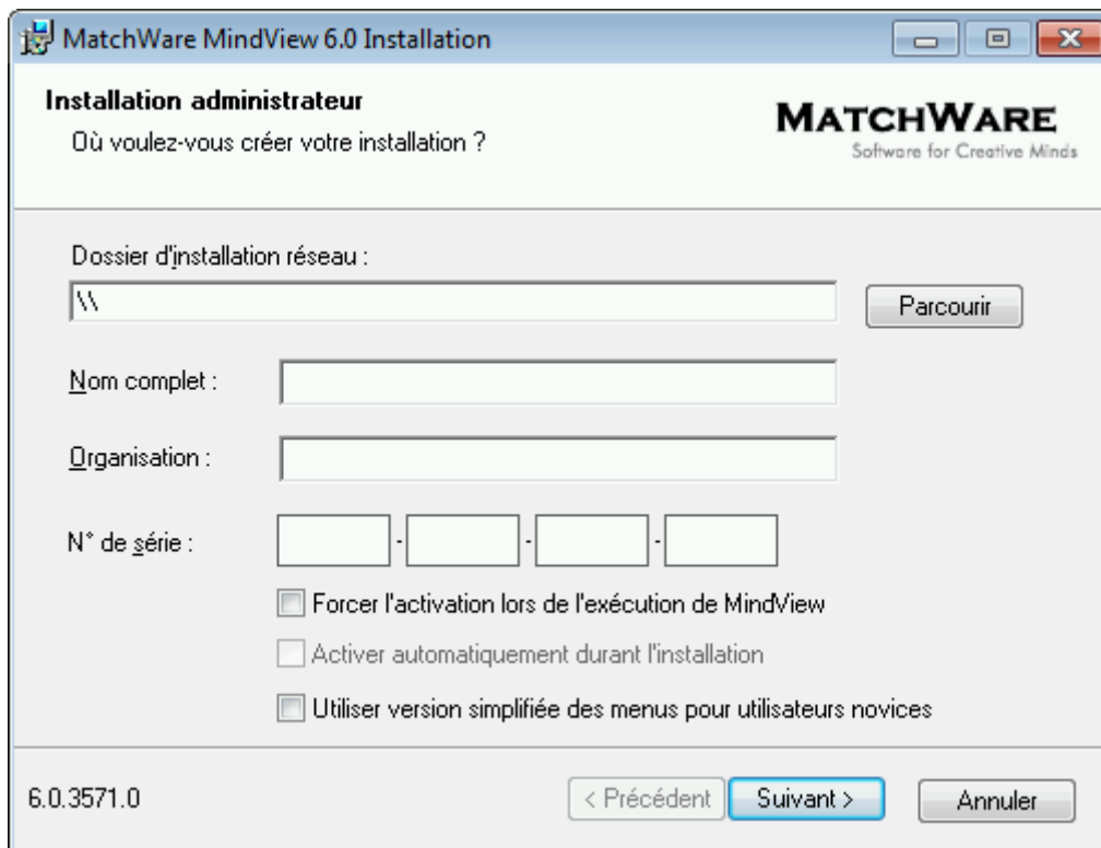
Figure 3 – Installation administrative de MatchWare MindView 6