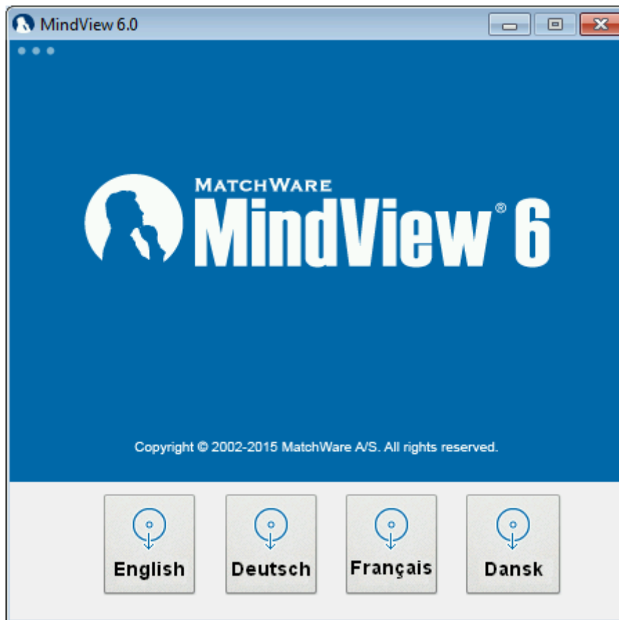
Figure 1 – Installation de MatchWare MindView – Menu du DVD

Si le programme d'installation de MindView ne démarre pas automatiquement :