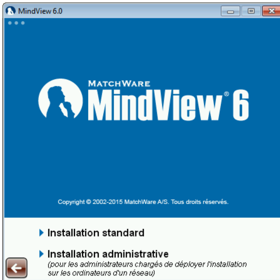
Figure 1 – MatchWare MindView – 2ème étape de l'installation

Pour démarrer l'installation administrative à partir de la ligne de commande, faites appel au paramètre standard "/a" de Windows® Installer.